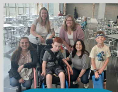
هنر در طیف