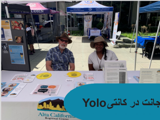
جشن جانت در کانتی Yolo