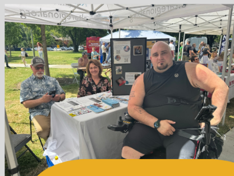
فستیوال اکرام برای اسلاوی‌ها