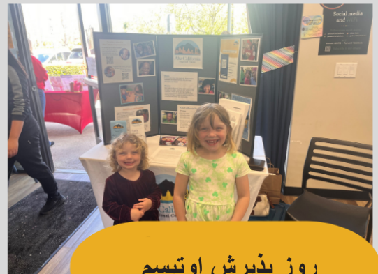
روز پذیرش اوتیسم