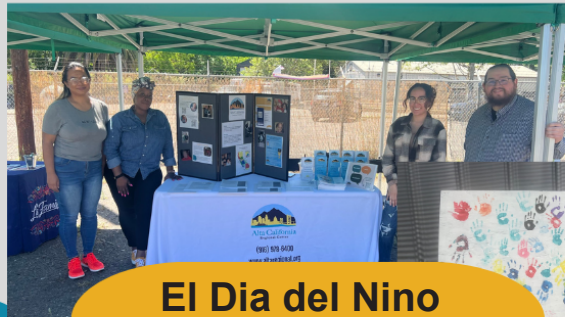
El Dia del Nino (روز کودک)