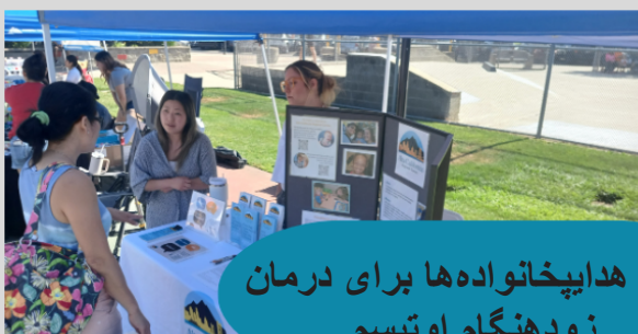
یور هدای خانوادها برای درمان زود هنگام اوتیسم