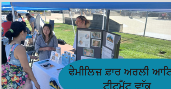
ਫੈਮੀਲਿਜ਼ ਫਾਰ ਅਰਲੀ ਆਟਿਜ਼ਮ ਟ੍ਰੀਟਮੈਂਟ ਵਾੱਕ