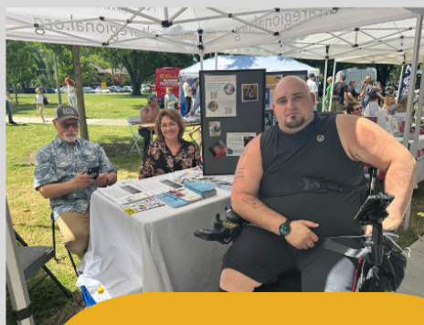
ਸਲੈਵਿਕ ਤਿਉਹਾਰ ਯਾਰਮਾਰਕਾ