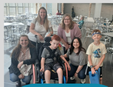
ਆਰਟ ਔਨ ਦ ਸਪੈਕਟ੍ਰਮ