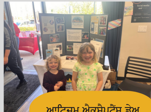
ਆਟਿਜ਼ਮ ਐਕਸੈਪਟੈਂਸ ਡੇਅ