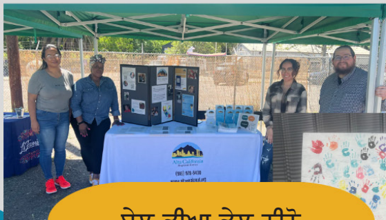
ਏਲ ਡੀਆ ਡੇਲ ਨੀਨੋ