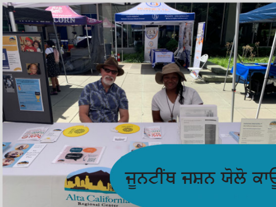
ਜੂਨਟੀਥ ਜਸ਼ਨ ਯੋਲੋ ਕਾਊਂਟੀ ਵਿਖੇ