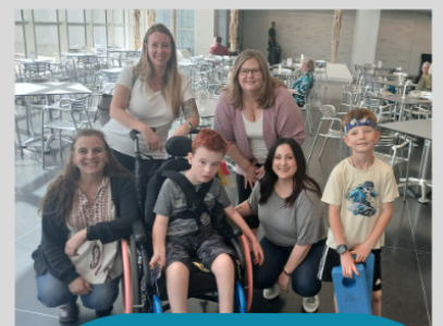
Искусство на Spectrum