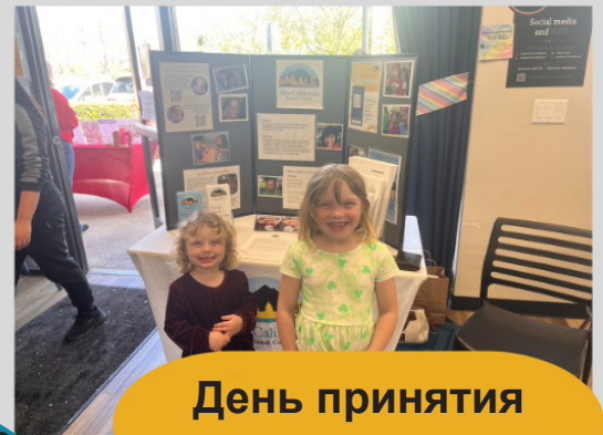
День принятия аутизма