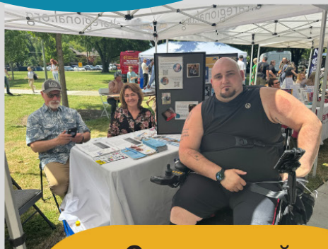
Славянский фестиваль ярмарка