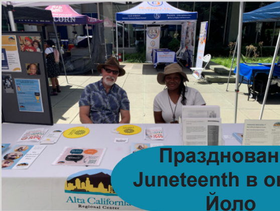
Празднование Juneteenth в округе Йоло