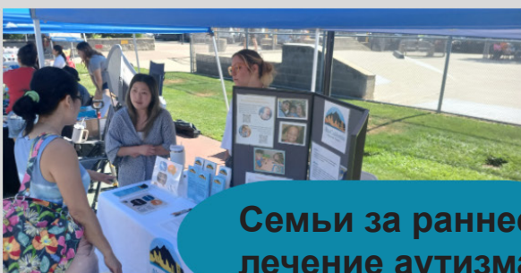
Семьи за раннее лечение аутизма