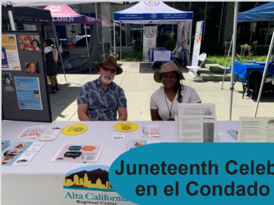
Juneteenth Celebración en el Condado Yolo