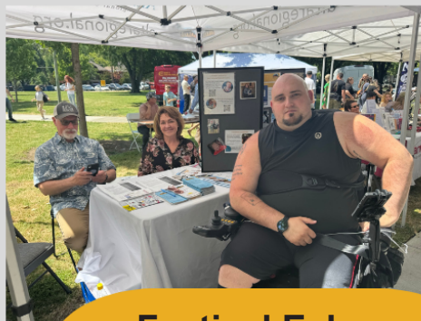
Festival Eslovo Yarmarka