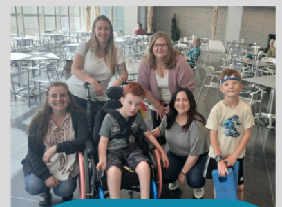
Arte en el Espectro