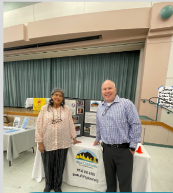
Feria de recursos para personas con discapacidad WeEmbrace