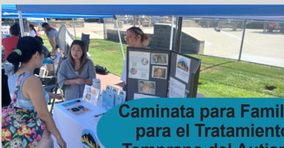
Caminata para Familias para el Tratamiento Temprano del Autismo