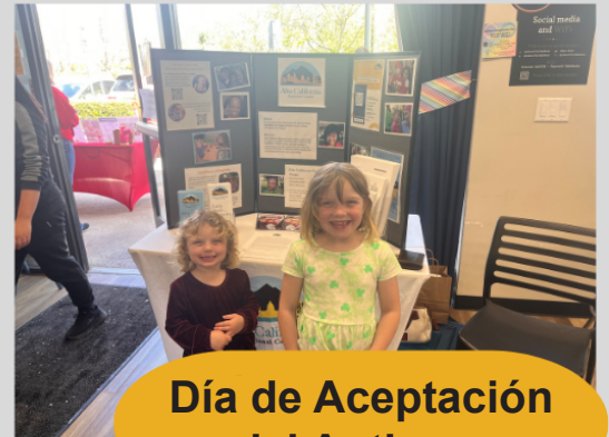
Día de Aceptación del Autismo