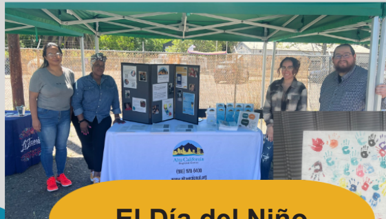
El Día del Niño