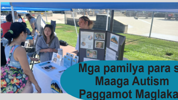
Mga pamilya para sa Maaga Autism Paggamot Maglakad