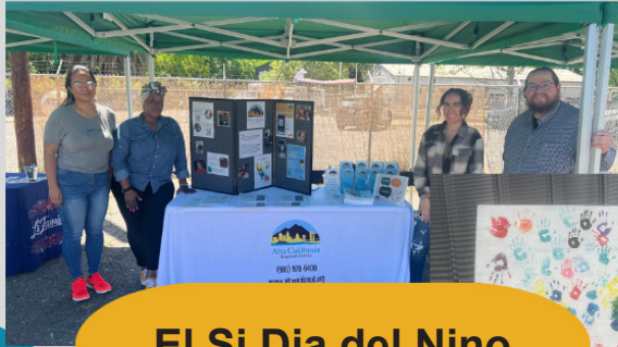
El Si Dia del Nino