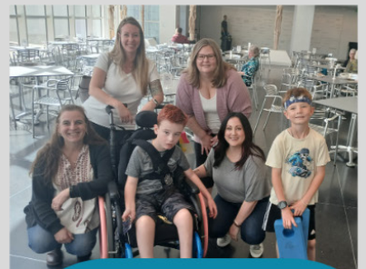
Art sa ang Spectrum