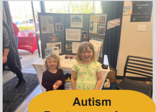
Autism Pagtanggap Araw