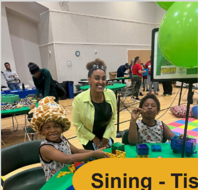
Sining - Tism