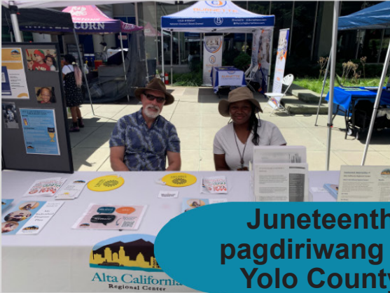
Juneteenth pagdiriwang sa Yolo County