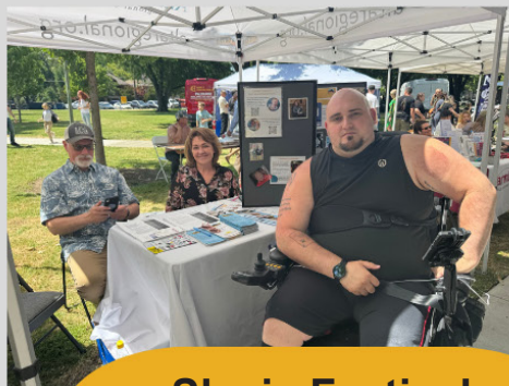
Slavic Festival Yarmaka