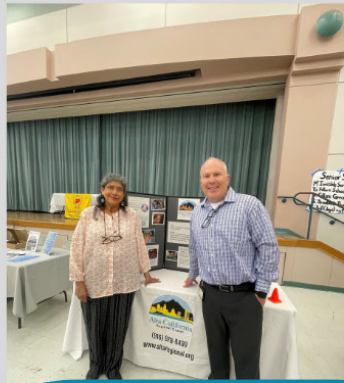
WeEmbrace Kapansanan mapagkukunan Patas