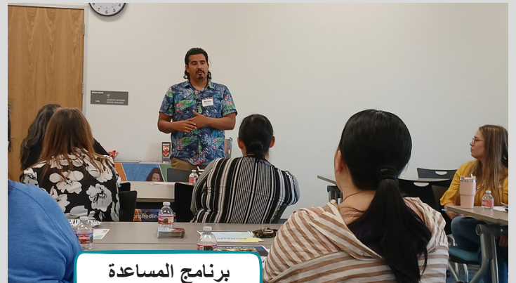
برنامج المساعدة المؤقتة للأسر القبلية في شينجل سبرينجز