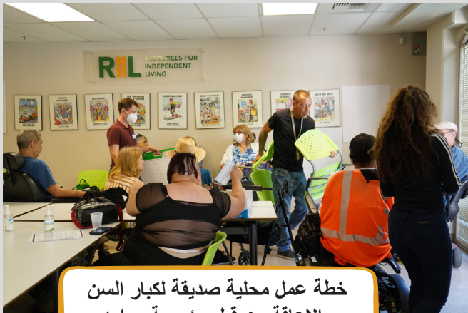
خطة عمل محلية صديقة لكبار السن والإعاقة من قبل مؤسسة موارد المعيشة المستقلة