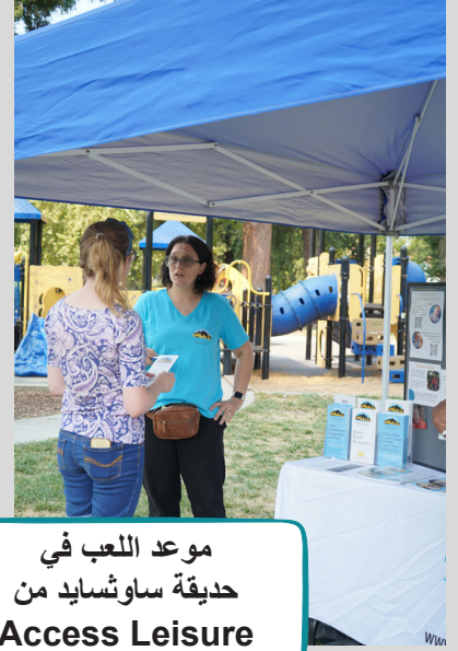
موعد اللعب في حديقة ساوثسايد من Access Leisure