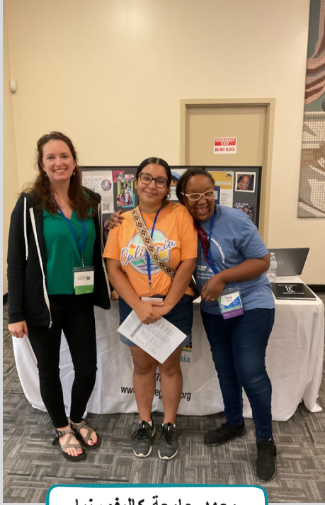
معهد جامعة كاليفورنيا ديفيس الصيفي للإعاقات العصبية التنموية