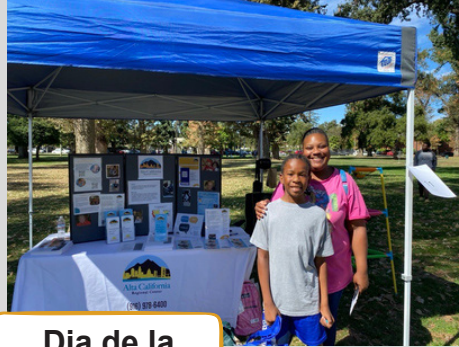
Dia de la Familia