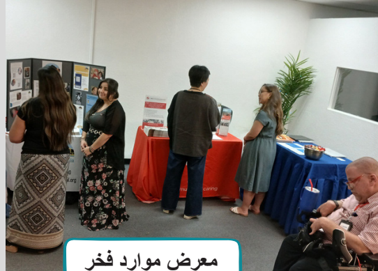
معرض موارد فخر ذوي الإعاقة