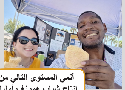
أنمي المستوى التالي من إنتاج شباب همونغ وأولياء الأمر المتحدون