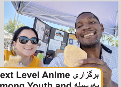
برگزاری Next Level Anime Hmong Youth and Parents United به‌وسیله