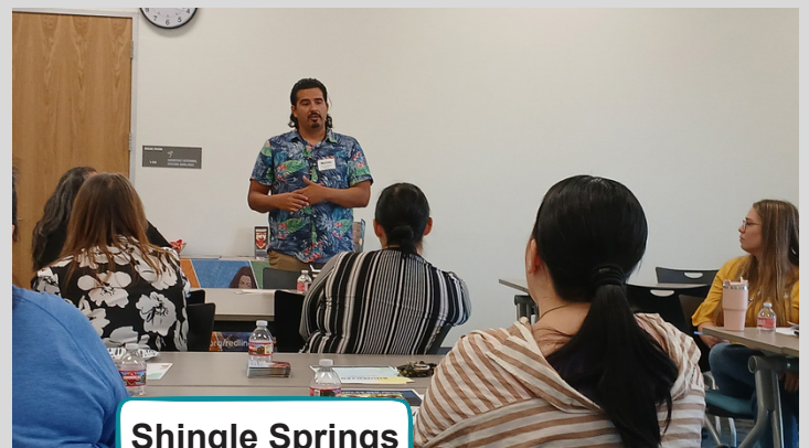
Shingle Springs Tribal TANF