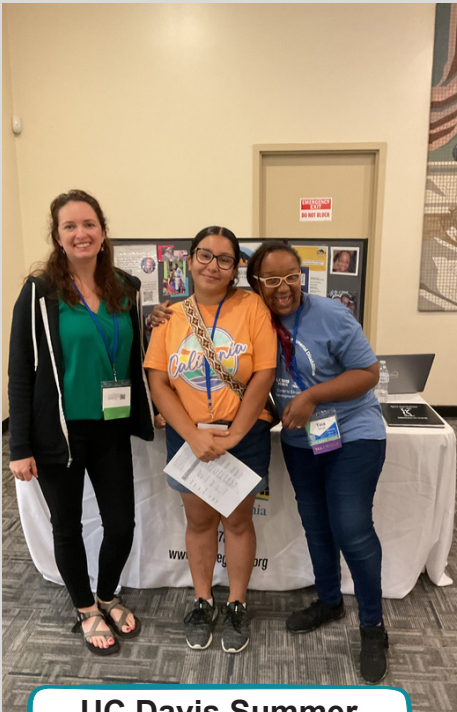
UC Davis Summer Institute در زمینه عقب‌ماندگی‌های عصبی-رشدی