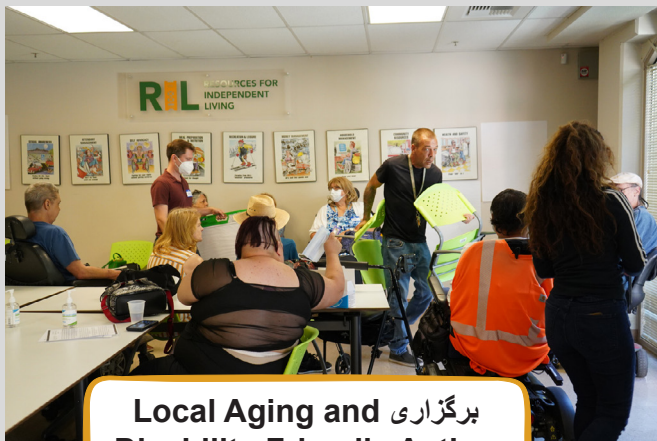
برگزاری Local Aging and Disability Friendly Action Plan به‌وسیله Resources for Independent Living