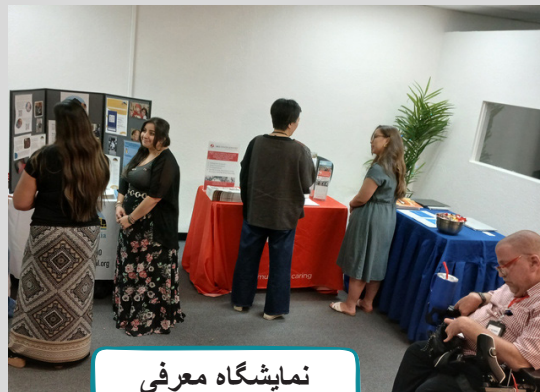
نمایشگاه معرفی Disability Pride