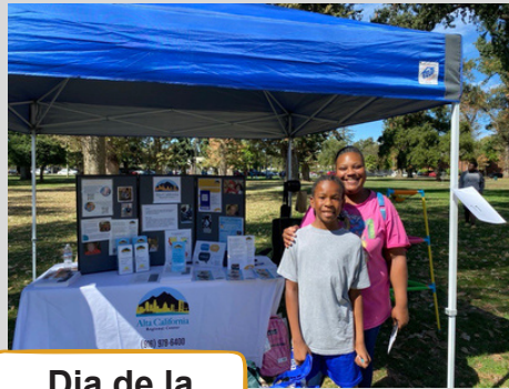
Dia de la Familia