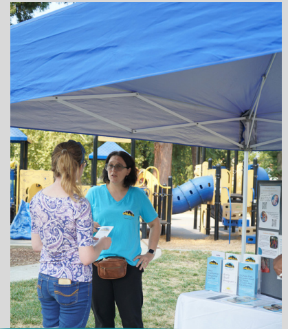
برگزاری Southside Park Play Date به‌وسیله Access Leisure