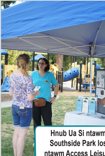
Hnub Ua Si ntawm Southside Park los ntawm Access Leisure

Yog tias koj xav koom cov koom txoos hauv zej zog, thov mus saib daim zwj chib hauv peb tus vev xaib ntawm https://www.altaregional.org/events-calendar . Yog tias koj yog ib tug neeg teeb tsa koom txoos thiab xav kom ACRC tuaj mus koom nrog lub koom txoos nthuav qhia, ces tiv tauj rau Shamir Griffin, Tus Kws Tshaj Lij Txog Ntau Yam Kab Lis Kev Cai los ntawm kev xa email rau sgriffin@altaregional.org .