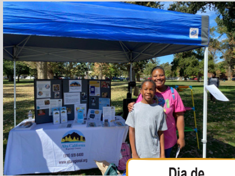
Dia de la Familia