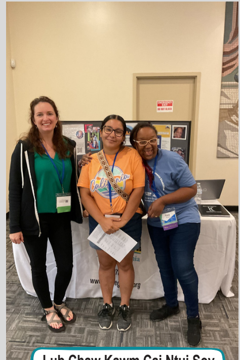
Lub Chaw Kawm Cai Ntuj Sov UC Davis hais txog Kev Xiam Oob Qhab Fab Kev Loj Hlob Ntawm Tej Hlab Hlwb