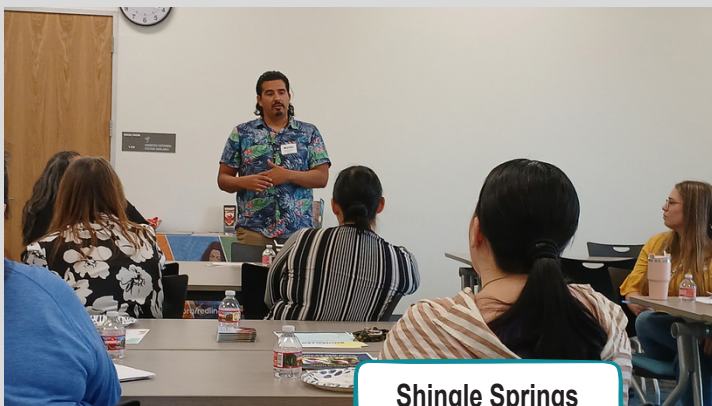
Shingle Springs Tribal TANF