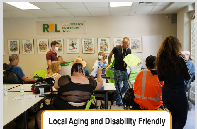
Local Aging and Disability Friendly Action Plan los ntawm Resources for Independent Living