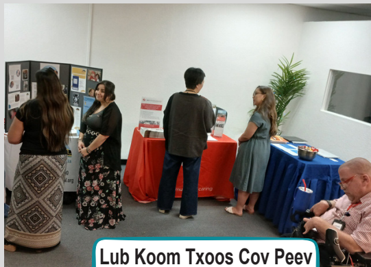
Lub Koom Txoos Cov Peev Txheej Kev Zoo Siab Rau Kev Xiam Oob Qhab