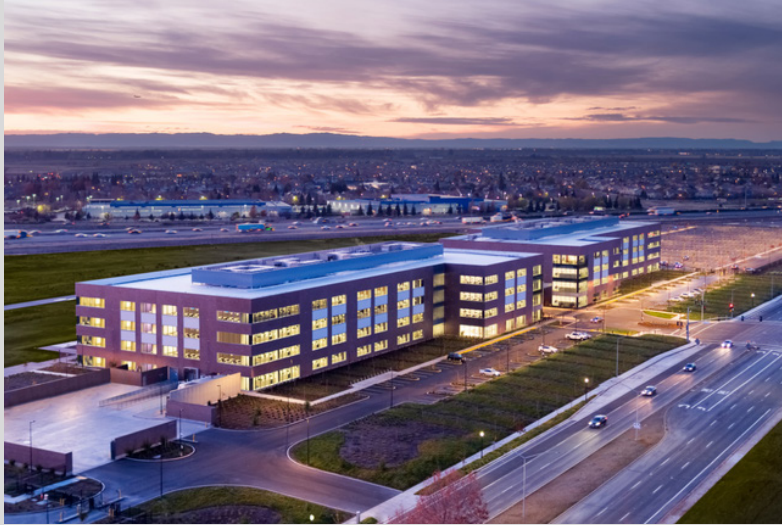
Новый офис ACRC в Сакраменто

Ежеквартальный бюллетень для клиентов, специалистов и сотрудников