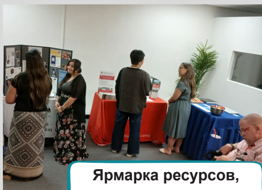
Ярмарка ресурсов, посвященная гордости инвалидов