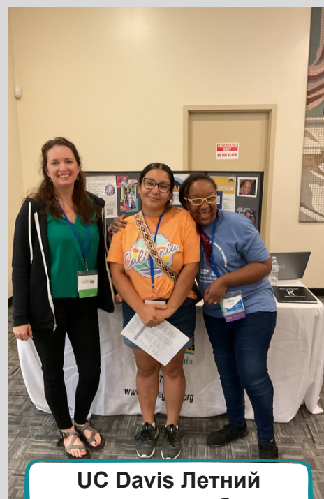
UC Davis Летний институт по проблемам нейроразвития