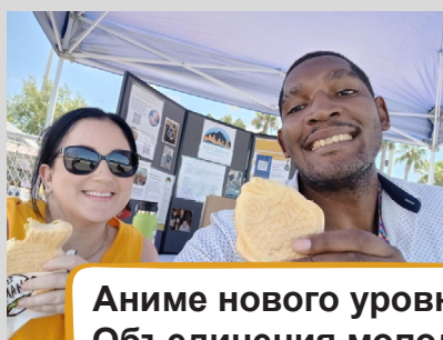
Аниме нового уровня от Объединения молодежи и родителей хмонг