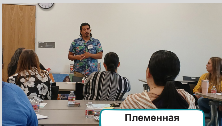
Племенная программа TANF в Шингл-Спрингс