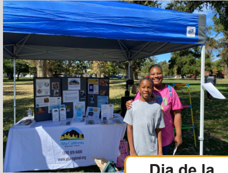
Día de la Familia