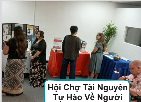
Hội Chợ Tài Nguyên Tự Hào Về Người Khuyết Tật