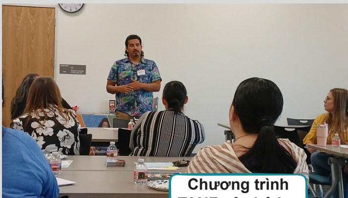
Chương trình TANF của bộ lạc Shingle Springs