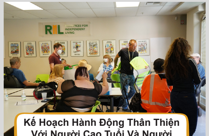
Kế Hoạch Hành Động Thân Thiện Với Người Cao Tuổi Và Người Khuyết Tật Tại Địa Phương của Resources for Independent Living