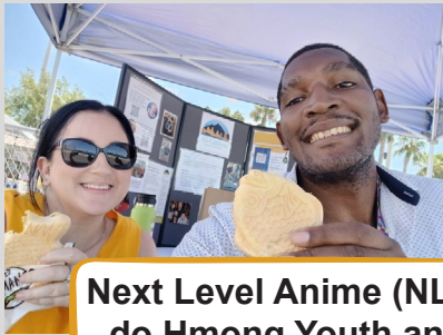
Next Level Anime (NLA) do Hmong Youth and Parents United tổ chức