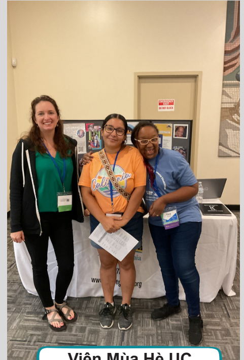
Viện Mùa Hè UC Davis về Khuyết Tật Phát Triển Thần Kinh