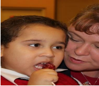
ACRC Santa Day, 2014