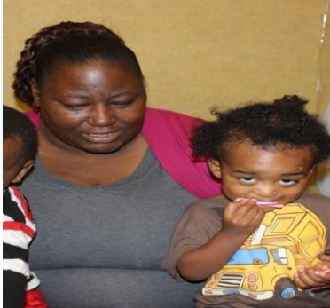
ACRC Santa Day 2014

Kev Pab Saib nyuam Fiscal Management Service (FMS): Leej niam leej txiv/tus neeg tu xyuas hais qhia tus neeg ua haujlwm tu nws tsev neeg rau kev pab saib nyuam FMS. FMS mam li cia tsev neeg ntawd xaiv tus uas yuav los muab kev pab tu thiab mam li them lawv ncaj nraim, tsis tas them raws li nws yog ib tus neeg ua haujlwm tom ib lub koom haum twg. Muaj ob hom kev pab saib nyuam FMS: ib yam yog FMS themnyiaj kiag rau tus neeg tu, hos yam ob yog thaum rov ntxiv nyiaj rau cov niam txiv uas them tus neeg saib lawv. Nyob rau ob yam tibs, cov niam txiv ua haujlwm rau lub regional center, thiab cov niam txiv ntiav, cob qhia, nav maim cov xaub moos tu, thiab yuav ib tus neeg uas muaj ntaub ntawv CPR/First Aid thiab kuaj background tibs ntawm tuaj saib.