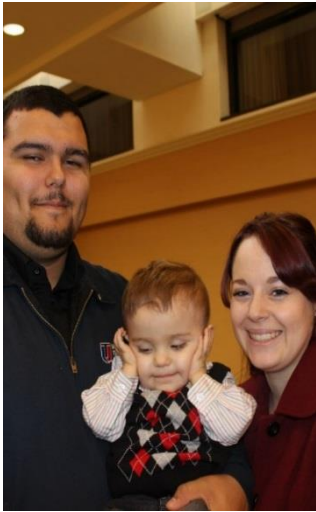
ACRC Santa Day 2014

"Tsis txhob ua haujlwm dhau lawm tsis nco qab txhawj txog lwm tus."